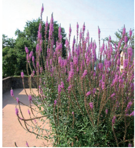
Lythrum salicaria (vivace)