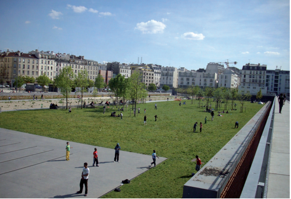
Les jardins d'Éole (Paris)