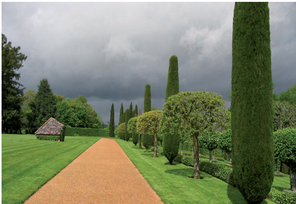
Des entretiens dits soutenus : ambiance jardin horticole. Les jardins d'Eyrignac (Dordogne).