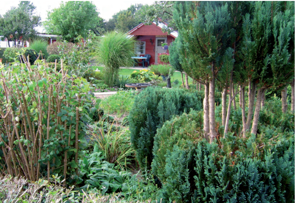
Le jardin potager : les colonies de jardin (Odense, Danemark)