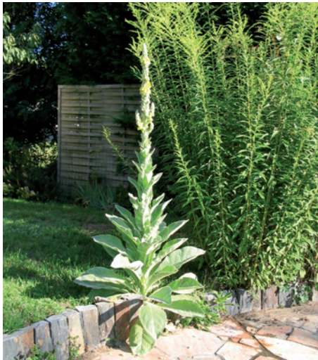
Verbascum thapsus (bisannuelle)