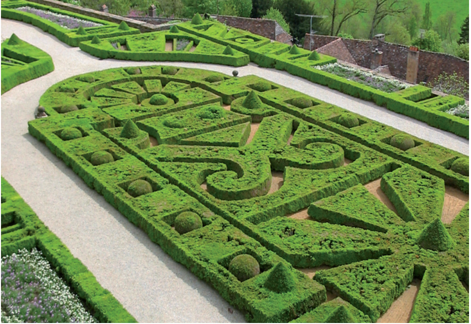
Jardins architecturés à la française : Hautefort (Dordogne)