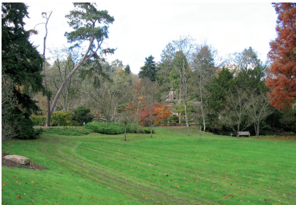
Des entretiens dits classiques : ambiance de jardin paysager. Le jardin oriental de Maulévrier (Maine-et-Loire).