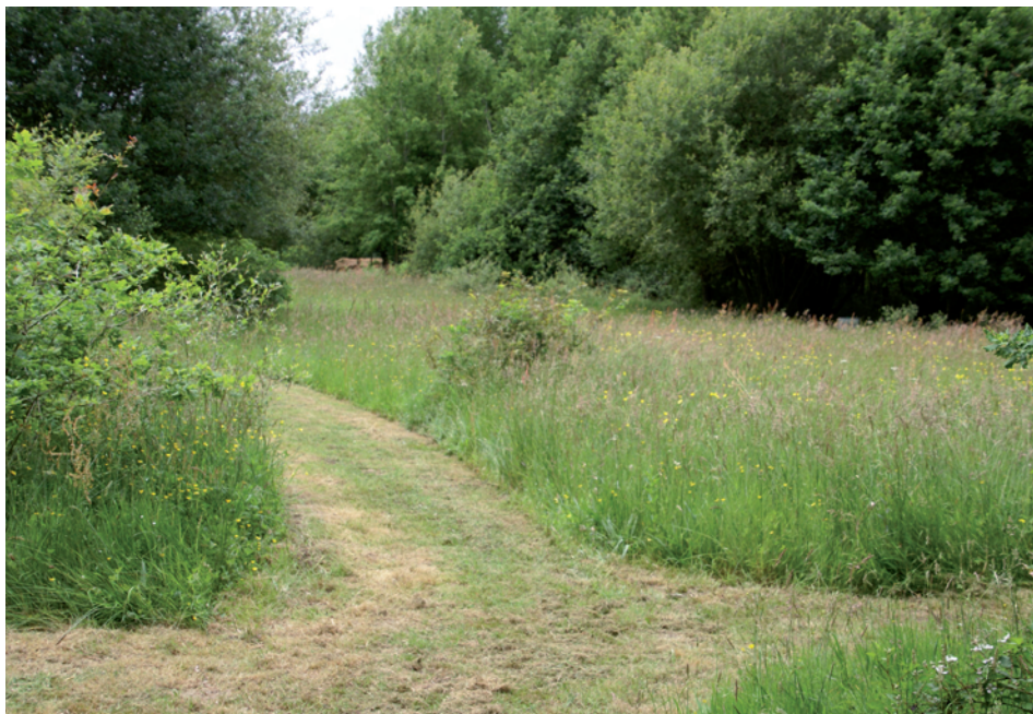
Le jardin en mouvement : lycée Jules Rieffel (Loire-Atlantique)