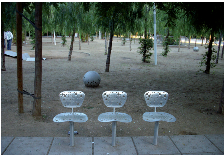
Parc moderne urbain : Del Poblenou (Barcelone, Espagne)