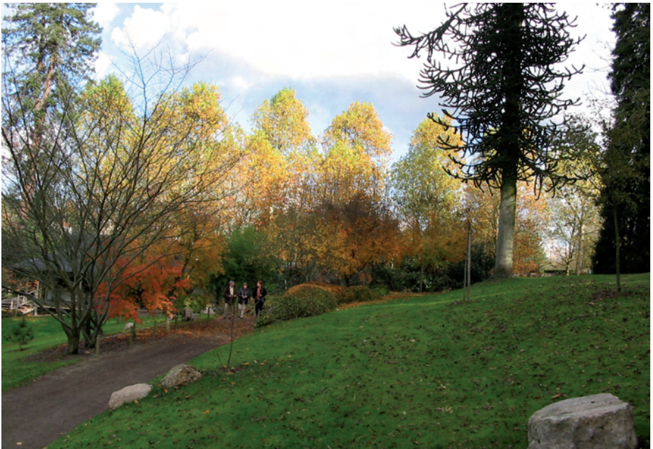
Jardin paysager à caractère oriental : Maulevrier (Maine-et-Loire)