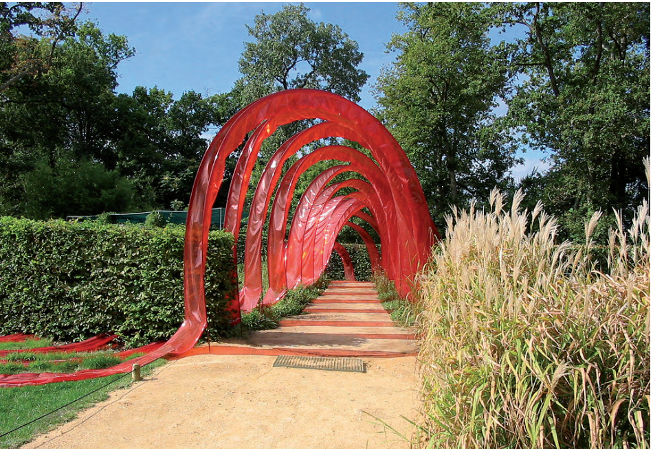
Festival des jardins 2003 (Chaumont-sur-Loire, Indre-et-Loire)