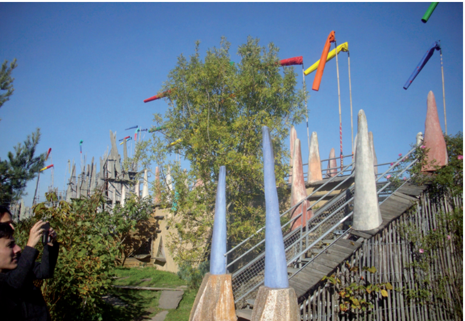
Le jardin étoilé (Paimboeuf)