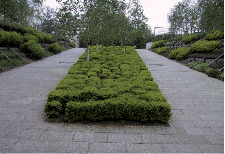
Le parc André Citroën (Paris)