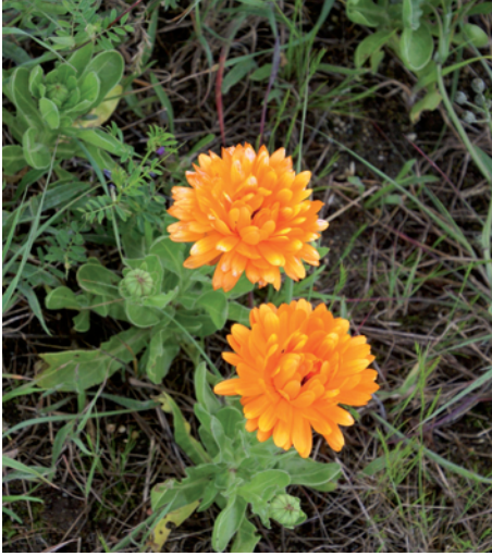
Calendula officinalis (annuelle cultivée)