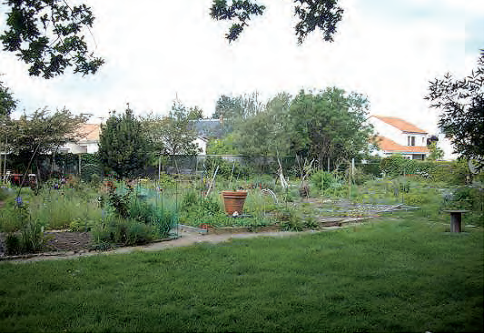
Les jardins familiaux (Rezé, Loire-Atlantique)