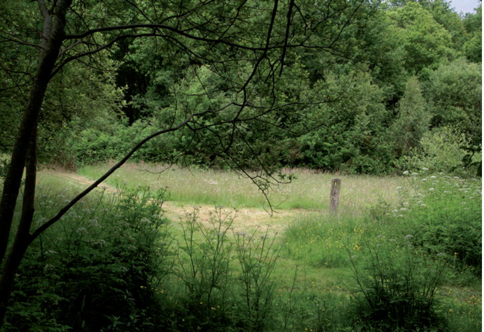
Des entretiens dits extensifs : ambiance de jardin champêtre. Le jardin en mouvement : lycée Jules Rieffel (Loire-Atlantique).